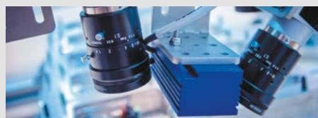
SYSTEMY WIZYJNE - AUTOMATYCZNA KONTROLA JAKOŚCI

Systemy Print&Apply umożliwiają automatyczne oznaczanie wyrobów już na linii produkcyjnej. Szeroka gama urządzeń i metod naklejania pozwala na elastyczne skonfigurowanie i integrację z linią produkcyjną.