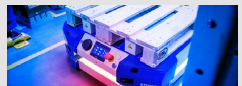
ROBOTY MOBILNE - AUTOMATYCZNA DYSTRYBUCJA

Inteligentne systemy wizyjne 2D i 3D oferują zaawansowaną analizę sceny i obiektu co umożliwia automatyczną inspekcję i weryfikację. Systemy wizyjne mogą skutecznie wspierać procesy zarządzania jakością.