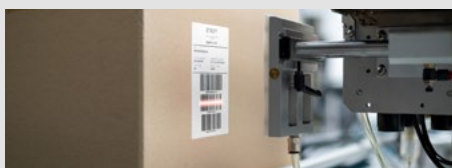
SYSTEMY PRINT&APPLY - AUTOMATYCZNE OZNACZANIE

Systemy Print&Apply umożliwiają automatyczne oznaczanie wyrobów już na linii produkcyjnej. Szeroka gama urządzeń i metod naklejania pozwala na elastyczne skonfigurowanie i integrację z linią produkcyjną.